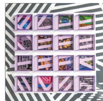
#CALLES / 2015 Fotografía en papel metálico con instalación de acrílicos y pintura 33 x 33 cm